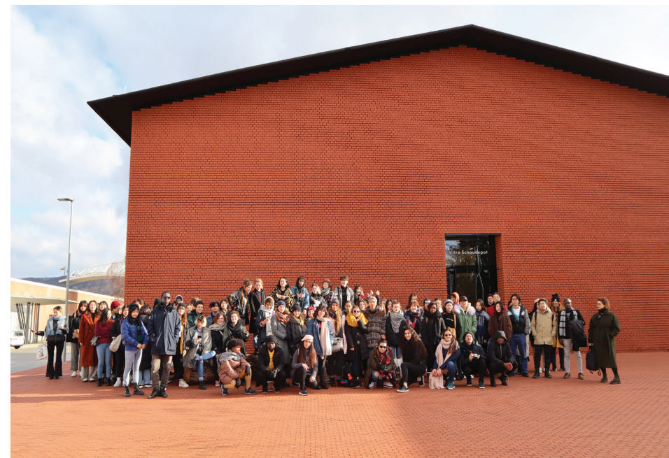
page de gauche : Vue d'atelier, Chapelle de l'Oratoire, Saint-Nazaire en haut : Terrasse avec vue sur la Suite de triangles de Felice Varini, Saint-Nazaire en bas : Voyage d'études, 2019.

Possibilité de bourses sur critères d'excellence