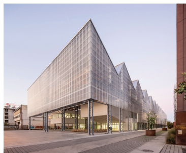
Site de Nantes. Architecture Franklin Azzi, 2017.

Les Beaux-Arts Nantes Saint-Nazaire sont situés au cœur d'un territoire culturel et artistique captivant avec de nombreuses galeries, musées et centres d'art à seulement deux heures en train de Paris.