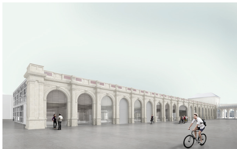
ci-dessus: Site de Saint-Nazaire. Architecture Titan, Nantes. Visuel 3D Titan, 2020 ci-dessous : Workshop sur la plage, Saint-Nazaire

En fonction des souhaits d'orientation de chaque étudiant, elle peut préparer à l'entrée en Licence 2 aux Beaux-Arts Nantes Saint-Nazaire ou dans d'autres écoles supérieures d'art et de design en France ou en Europe.