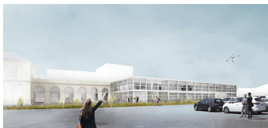
Site de Saint-Nazaire. Ouverture 1 er semestre 2022 Architecture Titan, Nantes. Visuel 3D Titan, 2020