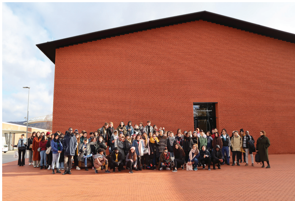
page de gauche : Vue d'atelier, Chapelle de l'Oratoire, Saint-Nazaire en haut : Terrasse avec vue sur la Suite de triangles de Felice Varini, Saint-Nazaire en bas : Voyage d'études, 2019.