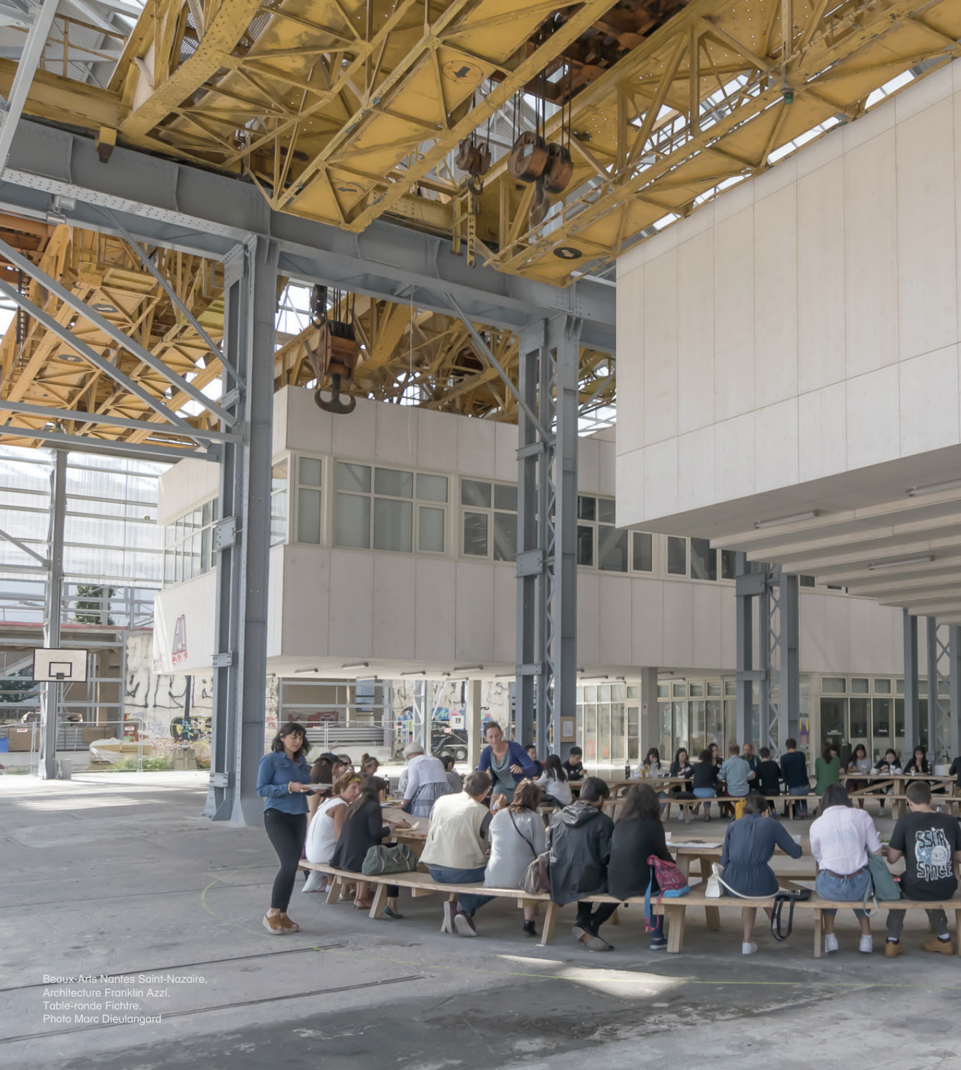
Begux-Arts Nantes Saint-Nazaire. Architecture Franklin Azzi. Table-ronde Fichtre. Photo Marc Dieulangard