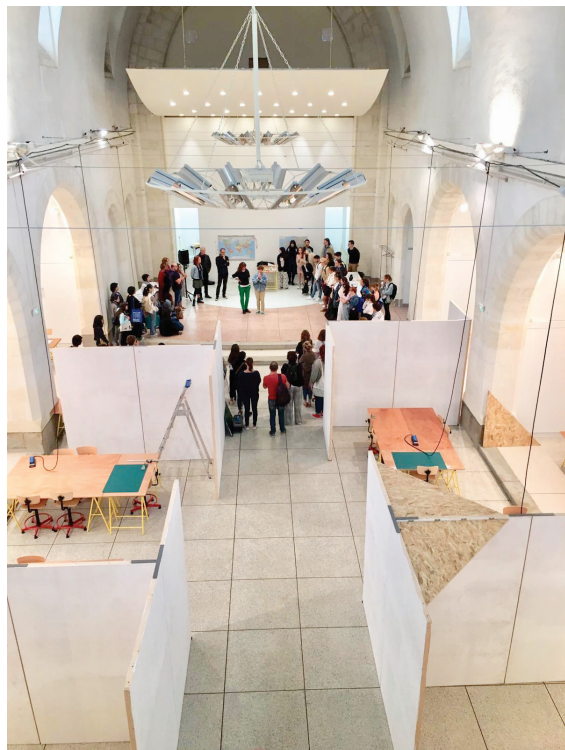
ci-contre : Jour de rentrée, Chapelle de l'Oratoire, Saint-Nazaire ci-dessous : Workshop sur la plage, Saint-Nazaire