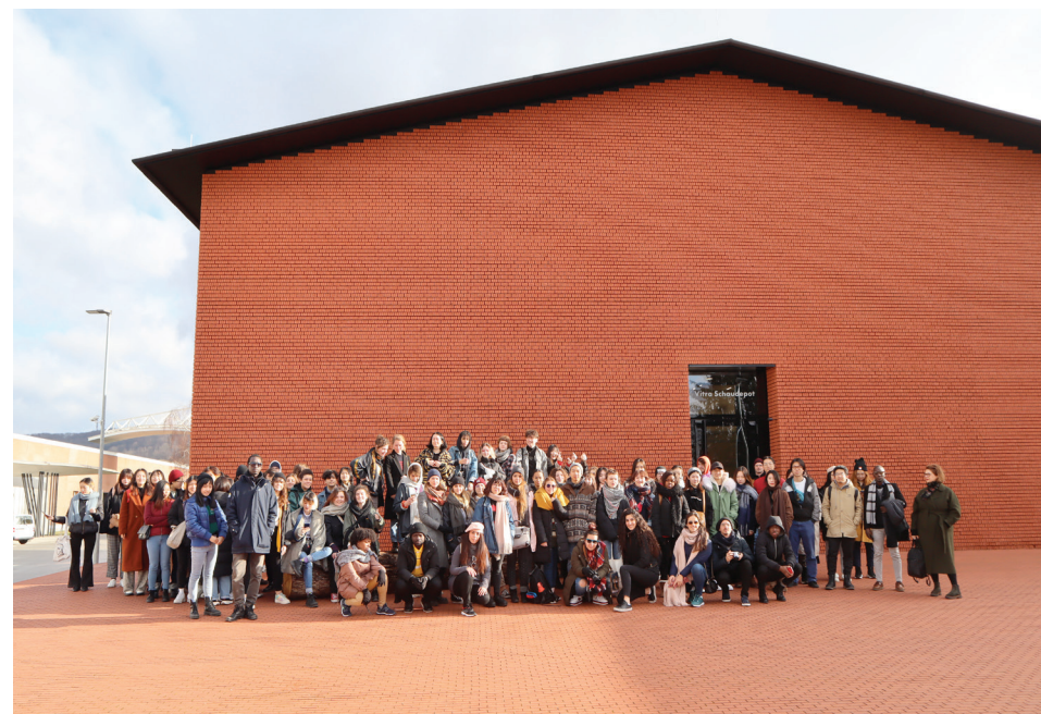
page de gauche : Vue d'atelier, Chapelle de l'Oratoire, Saint-Nazaire en haut: Terrasse avec vue sur la Suite de triangles de Felice Varini, Saint-Nazaire en bas: Voyage d'études, 2019. Photo Beaux-Arts Nantes Saint-Nazaire

** Montant non remboursable après inscription