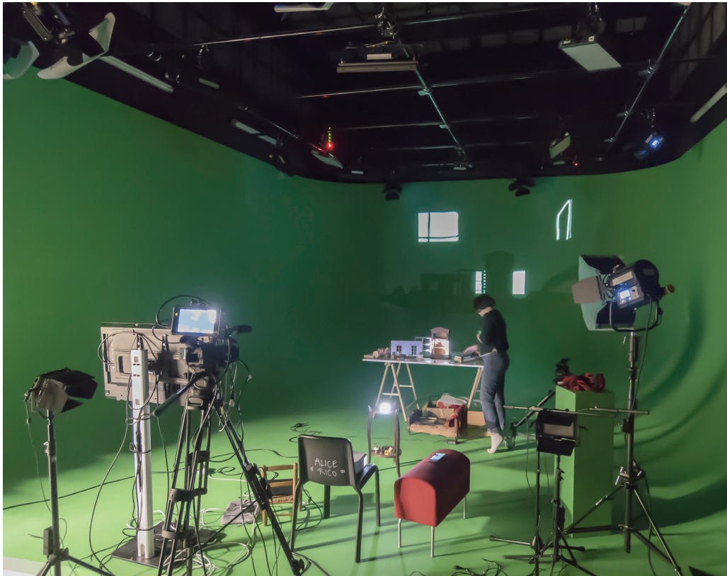
Atelier Print et plateau Cyclo, Beaux-Arts Nantes

De nombreux enseignants du PIE sont également bilingues français/anglais